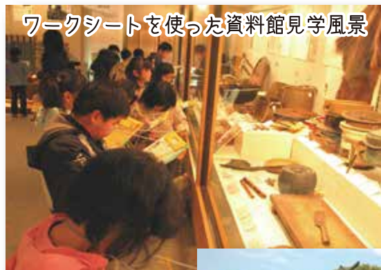
ワークシートを使った資料館見学風景

岩橋千塚古墳群をはじめとする県内の遺跡と民俗に関する資料の展示を行っています。人類の生活が始まった旧石器時代、土器を使用し始めた縄文時代、米作りが始まった弥生時代、豪族や有力氏族が大きな墓を作った古墳時代などの遺跡と、現代の便利な機器が普及する前に用いられていた道具など、郷土の歴史と民俗を紹介しています。