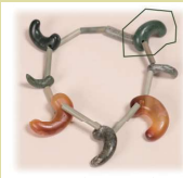
[真島1号墳(有田市)玉珮(実物に1点だけ贋作が混じる)]

骨董的価値を追求して作成されたフェイク(贋作)や見学者の理解促進のために作成されたフェイク(レプリカ)の展示を通じて、その特徴や製作背景を紹介します。