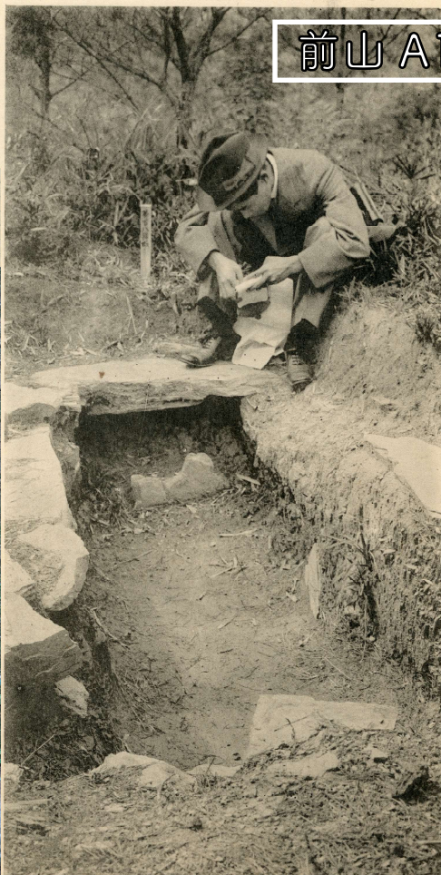
前山 A111 号墳