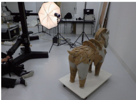
事前調査・写真撮影 *