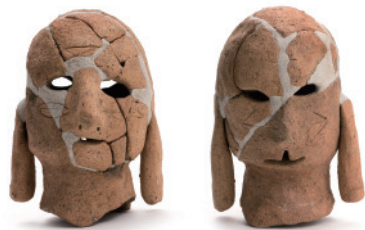
両面人物埴輪 *写真は同一個体の各面