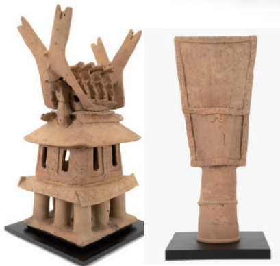
令和 4 ~ 6 年度事業で保存修理が完了した 三分割焼成の家形埴輪 (左) と胡籙形埴輪 (右)