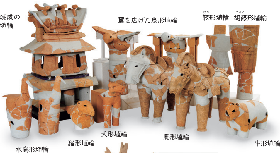
ゆぎ 靱形埴輪 ころく 胡籙形埴輪