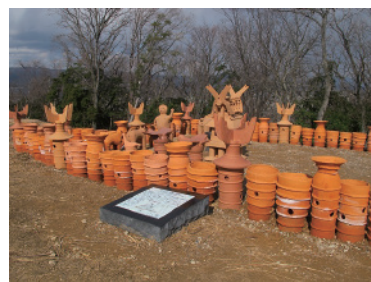
大日山 35 号墳東造り出し現状

※ 紀伊風土記の丘の資料館は、令和7年度末をもって一時休館し、令和10年度下期(予定)に和歌山県立考古民俗博物館(仮称)として開館します。重要文化財の公開情報については、別途ホームページなどでお知らせします。